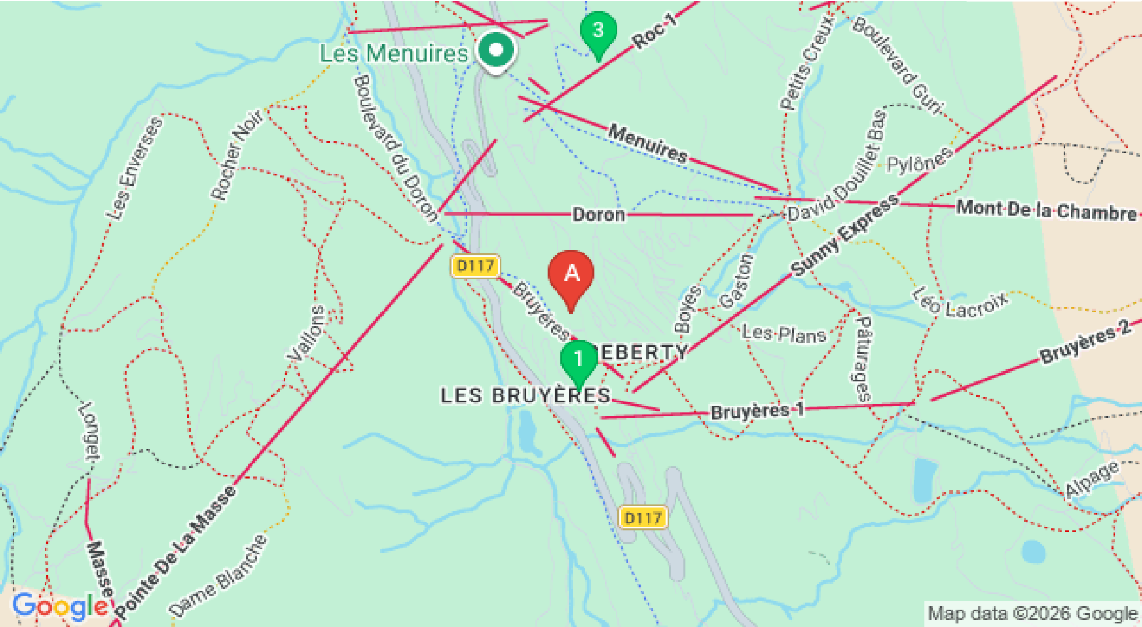
Map data ©2026 Google